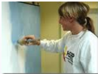
Bau- und Metallmaler