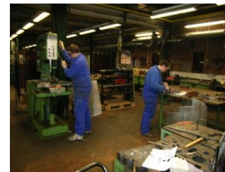
Fachpraktiker/in für Metallbau