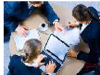
Fachpraktiker/in für Bürokommunikation