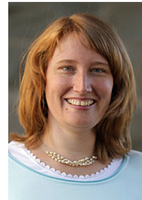
Kirsten Ritterswürden Marienheide, Bergneustadt, Wiehl, Nümbrecht