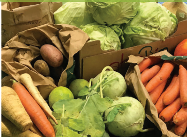
Was der Schulgarten hergibt